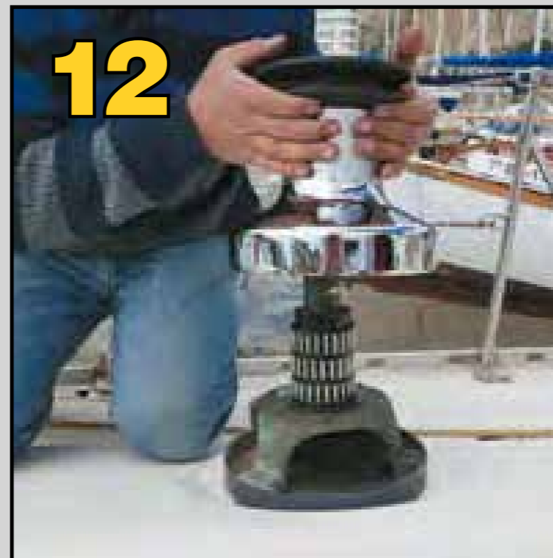
Instalación a bordo del winche restaurado