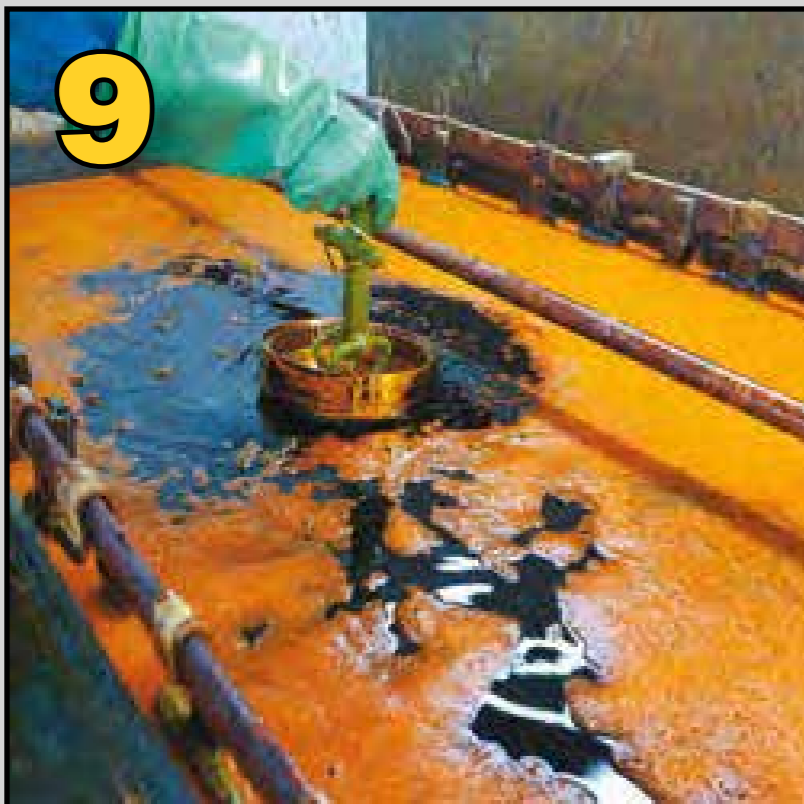
Baño de cromo para conseguir el acabado final