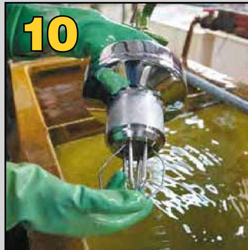
Limpieza con agua